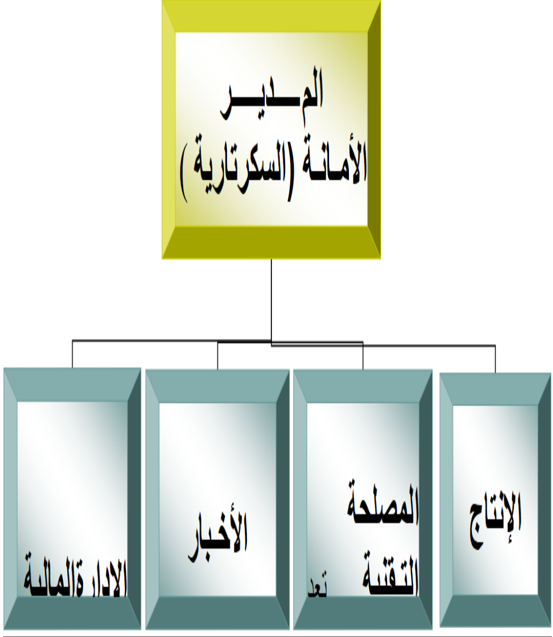
الشكل رقم 1: رسم تخطيطي لإذاعة الاغواط الجهوية