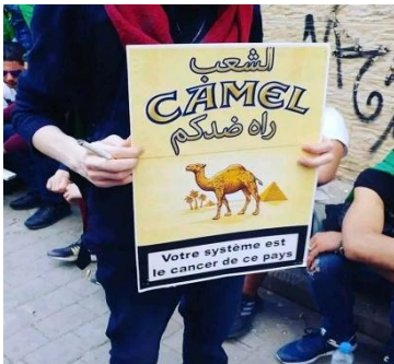
L'image 8 :

Cette image signale un avertissement de la part du peuple au président Bouteflika en l'interdisant de participer aux élections présidentielles.