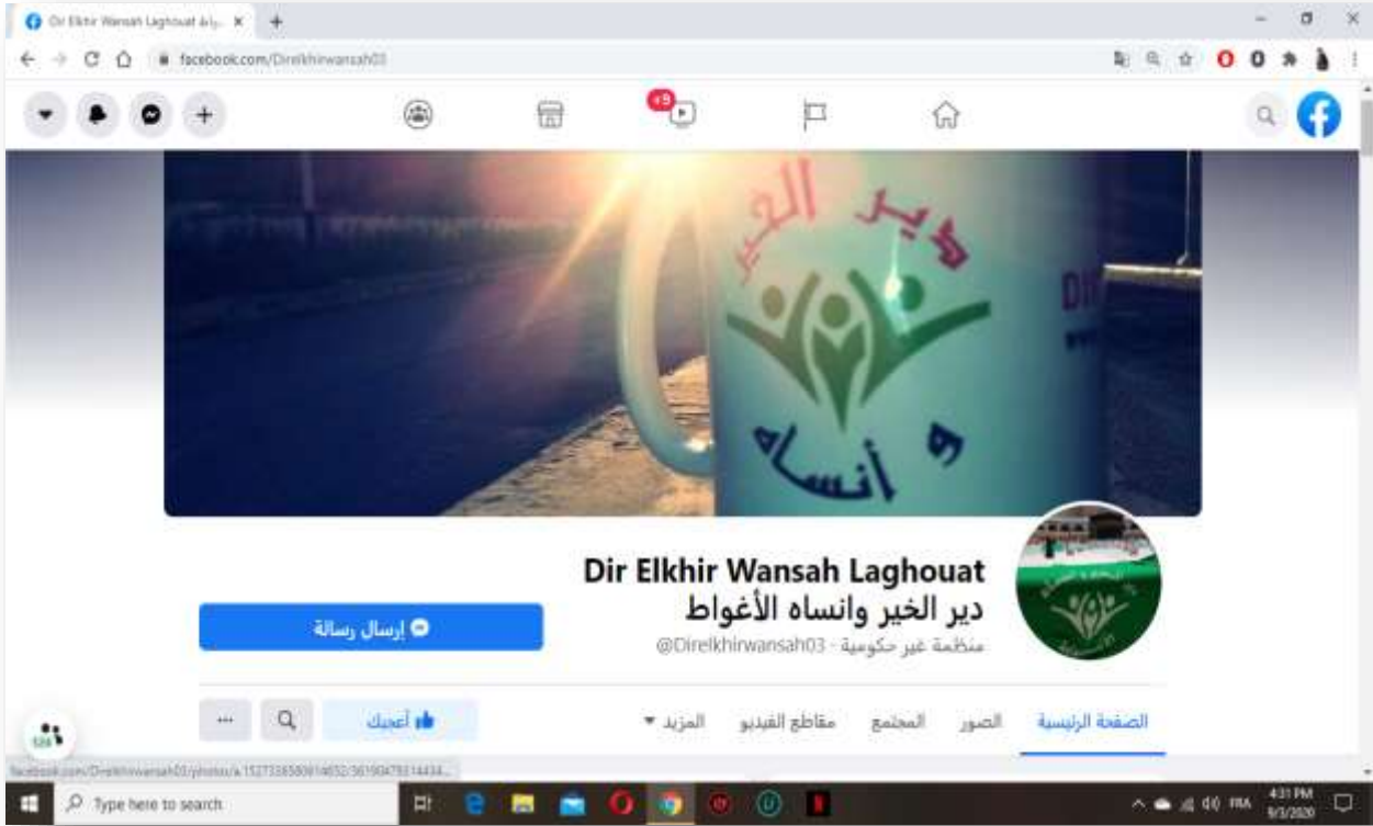
صورة لصفحة دير الخير وانساه