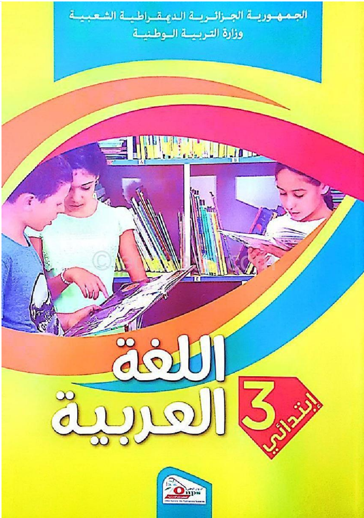
الصورة رقم 01: تمثل الغلاف الخارجي للكتاب