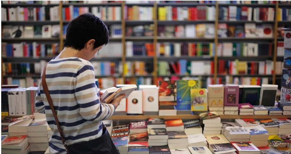
Figura 3: Imagen..