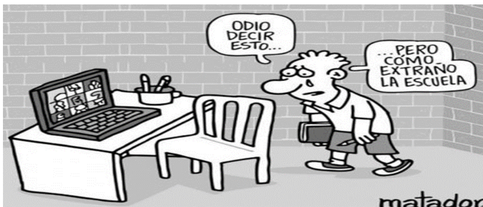
Figura 1: Caricatura. (fuente https://www.eltiempo.com/ ).

De ahí, decimos que las caricaturas son una forma expresiva y un retrato de personas u objeto basada en una representación gráfica. Es un tipo de expresión sarcástica y exagerada de la realidad y los problemas sociales.