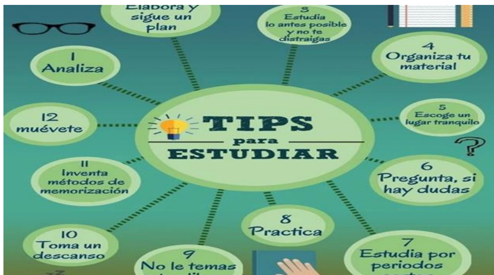
Figura 4: Mapa conceptual.

A partir de lo citado interiormente, el aprendizaje visual es un recurso de enseñanza-aprendizaje, a través del cual se utiliza gráficos, mapas conceptuales y diagramas con el objetivo de representar y transmitir el saber.