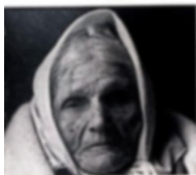
Fadhma Aïth Mansour Amrouche

Dans ce livre magnifique, elle raconte sa vie de femme et le destin des Kabyles, « tribu plurielle et pourtant singulière, exposée à tous les courants et pourtant irréductible, où s'affrontent sans cesse l'Orient et l'Occident, l'Algérie et la France, la Croix et le Croissant, l'Arabe et le Berbère, la montagne et le Sahara, le Maghreb et l'Afrique... ».