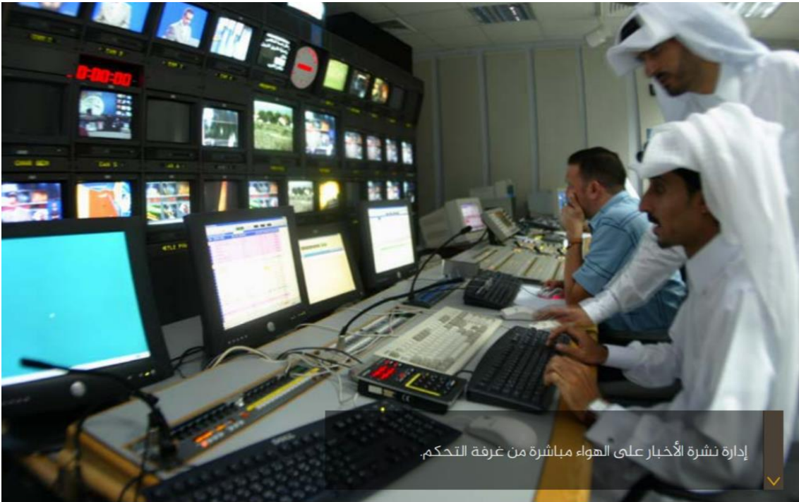
الملحق رقم "4": صورة مأخوذة من مجلة الصحافة العدد السابق تظهر غرفة تحكم بقناة الجزيرة.