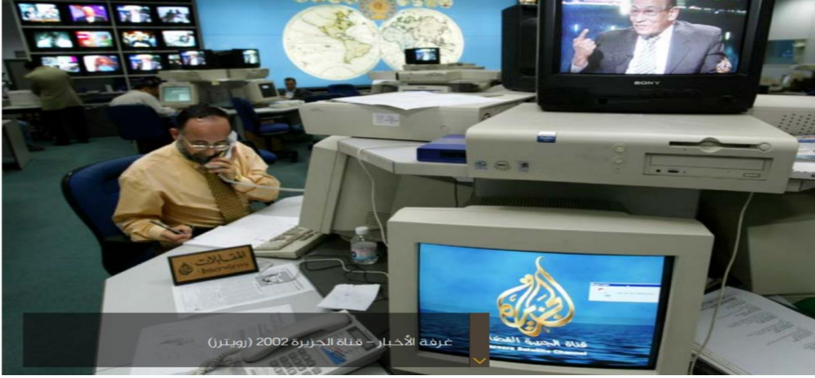
الملحق رقم "3": صورة مأخوذة من مجلة الصحافة، رحلة الجزيرة في طريق وعر، العدد (3) 2016 تظهر غرفة الاخبار بقناة الجزيرة لعام 2002.