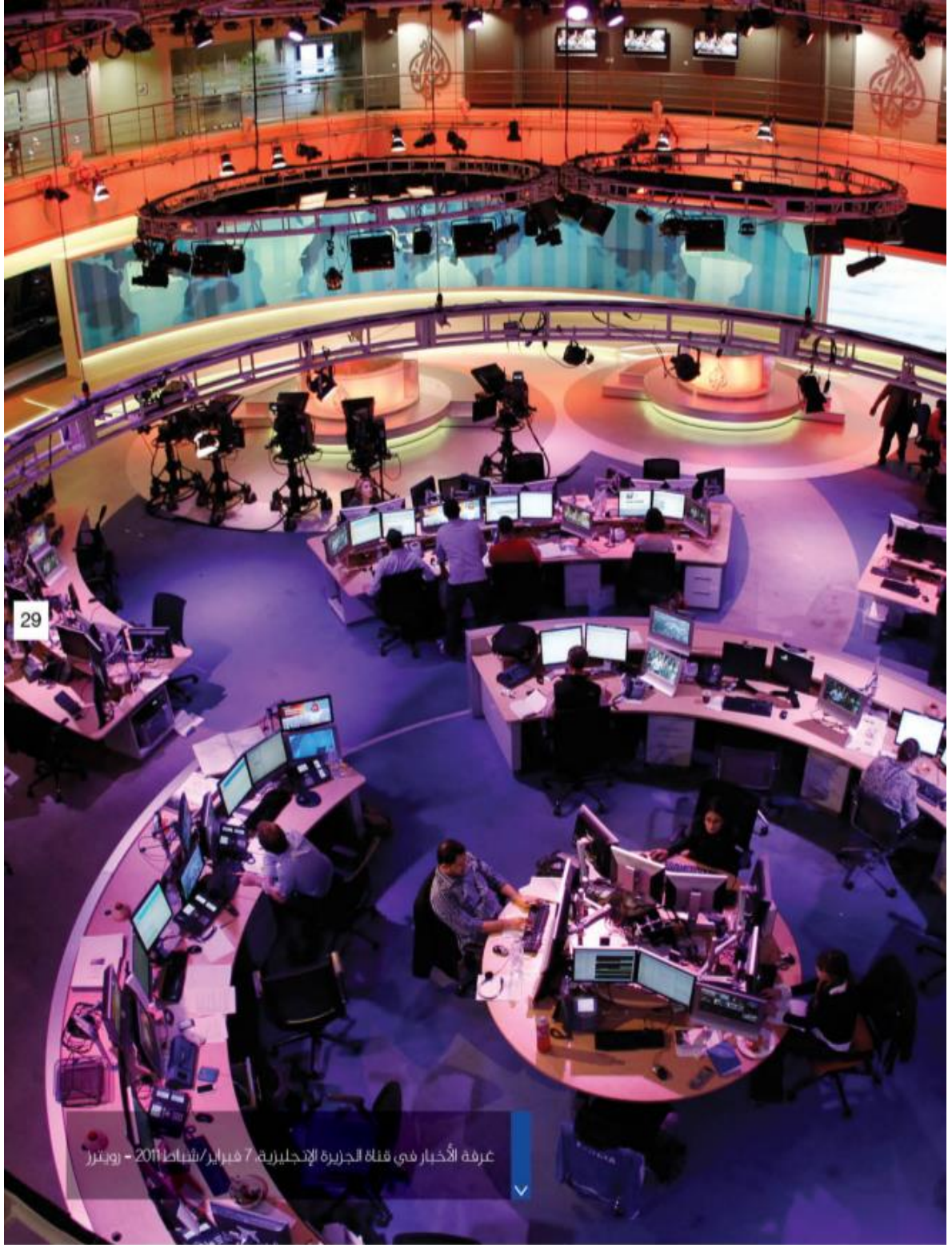
الملحق رقم "05": صورة مأخوذة من مجلة الصحافة، غرف الاخبار الذكية، العدد (2) 2016 تظهر غرفة الاخبار بقناة الجزيرة لعام 2011.