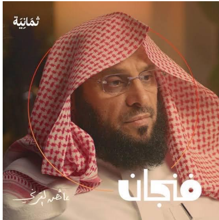
الملحق رقم (6): يوضح الضيف "عائض القرني"