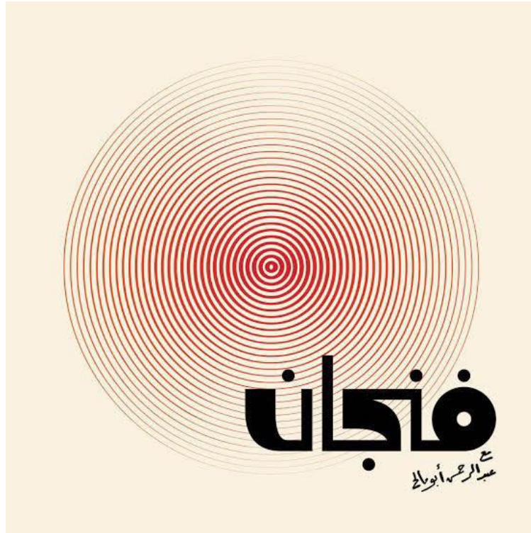
الملحق رقم (3): يوضح شعار بودكاست فنجان