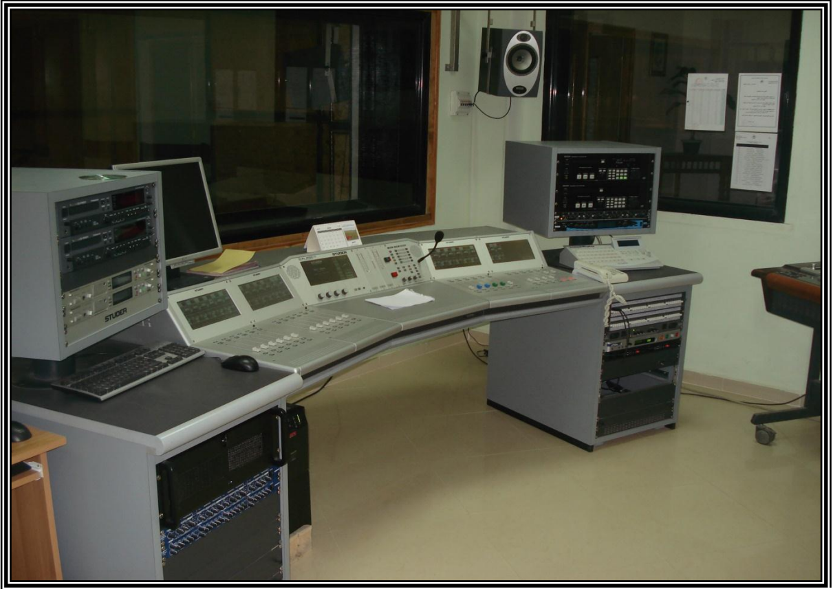
صورة حديثة لأجهزة إذاعة الأغواط