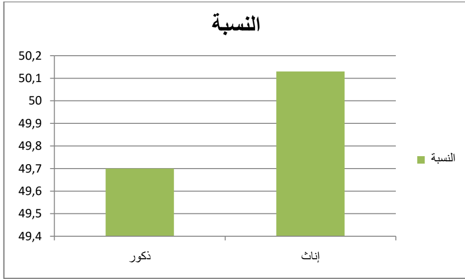
رسم بياني رقم(01)توزيع بياني يوضح توزع العينة حسب الجنس