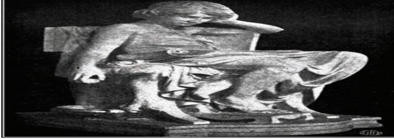
أرسطو في شبابه.