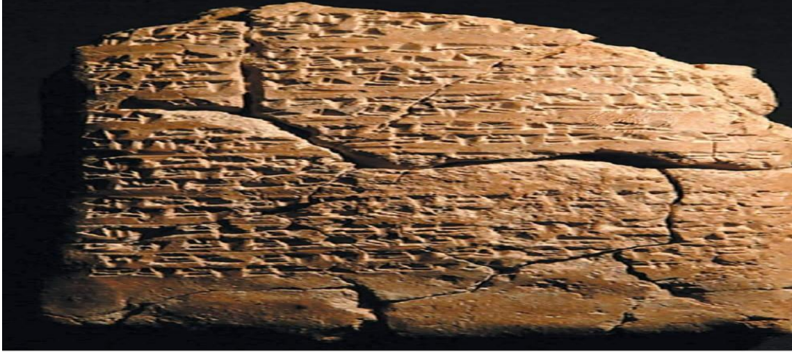
كتابة مسمارية (1600-1300 ق.م)