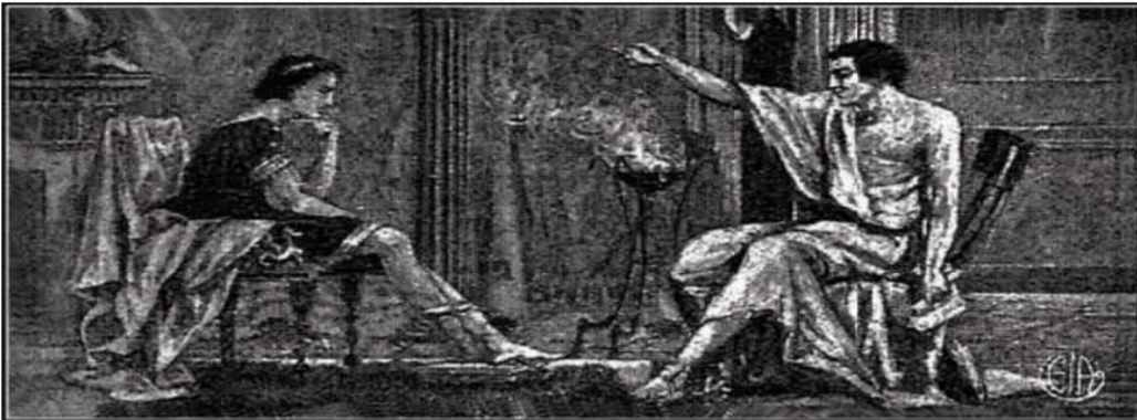
أرسطو مع أحد تلاميذه في أثينا.

المصدر : زكي نجيب محفوظ و أحمد امين ، المرجع لسابق ، ص 137