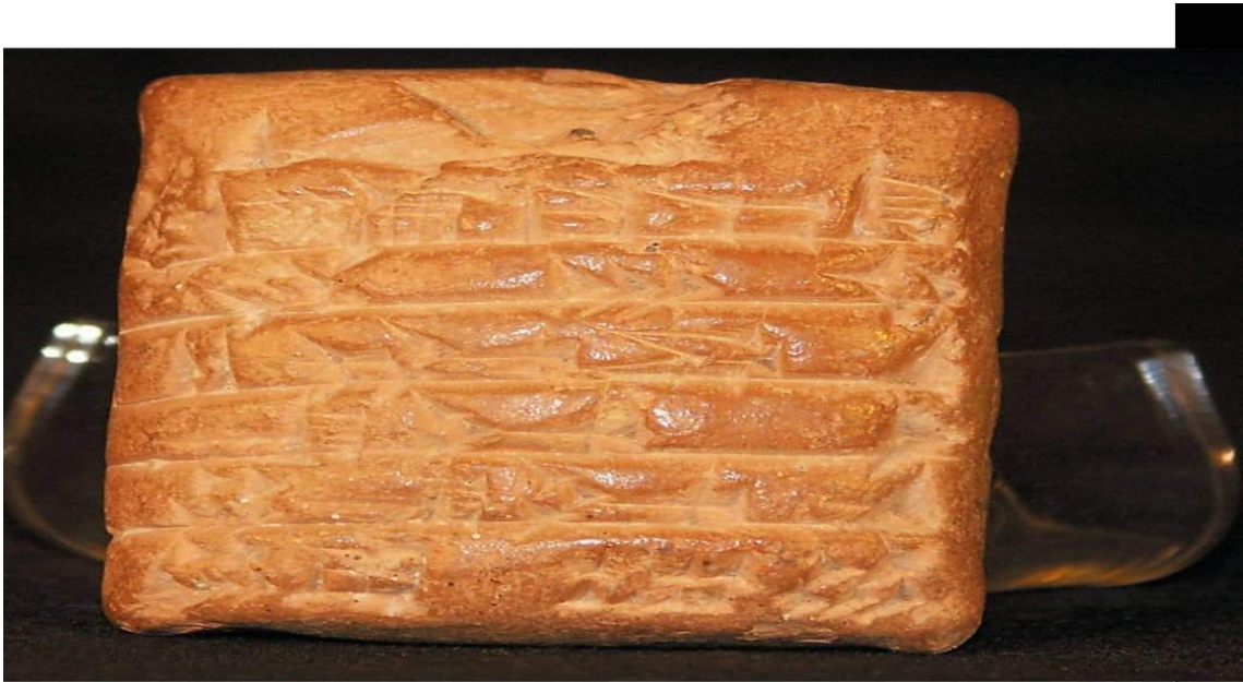
لوح كتابة مسمارية من بلاد ما بين النهرين (2400-1700 ق.م)