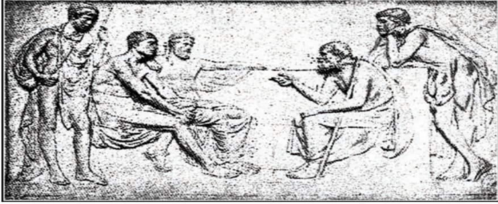
سقراط في حلقة الدرس.