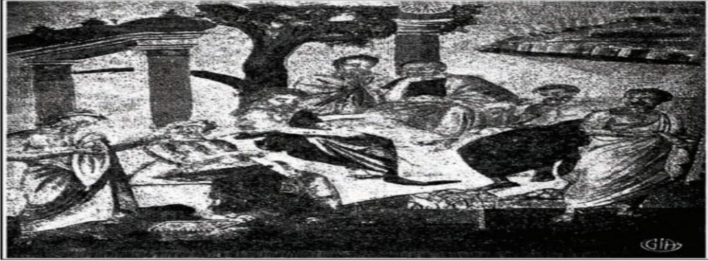
أفلاطون مع تلاميذه (وهو أولهم من الشمال).