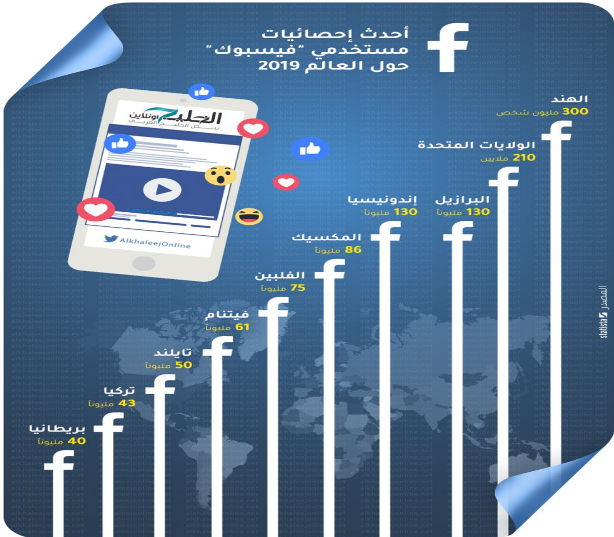
شكل يوضح عدد مستخدمي الفيسبوك حول العالم لسنة 2019.