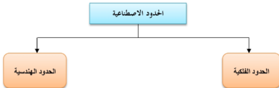
الشكل رقم 03 : يوضح أنواع الحدود الصناعية.

والحدود الاصطناعية إما إن تكون فلكية أو هندسية: