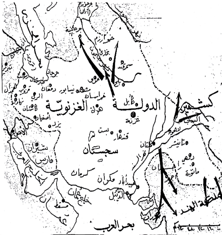
المرجع: الميداني، محمود عصام، الأطلس التاريخي للعالم الإسلامي، دار دمشق للتوزيع والطباعة، ط1، 1995، ص31.