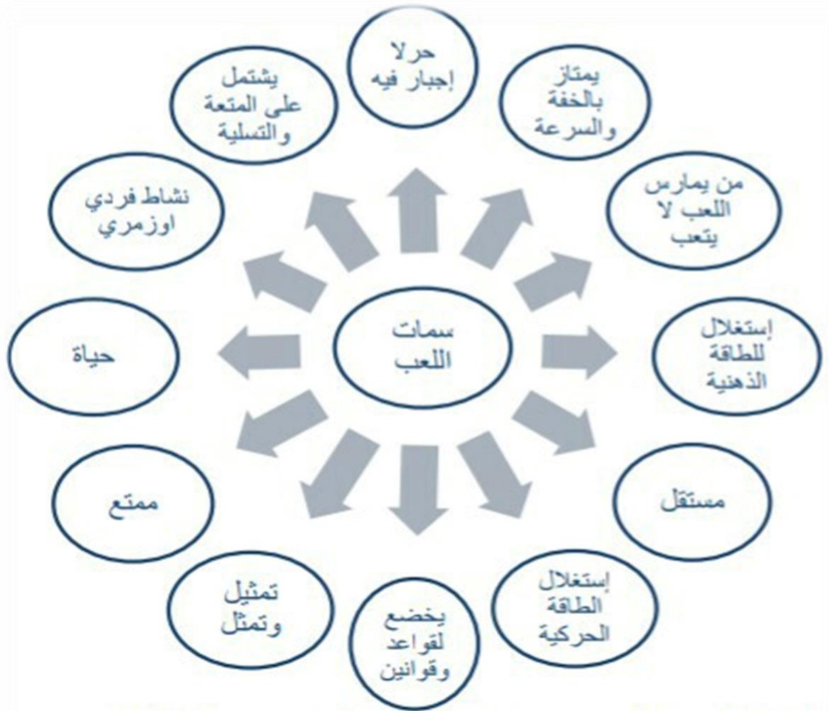
الشكل (1): مخطط توضيحي لسمات اللعب ( بلقيس و مرعي 1987).

وهذا قد أورد بلقيس ومرعي الشكل التالي والذي يمثل خصائص اللعب :