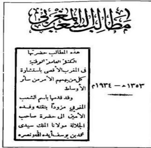
الوجه الأول من غلاف مطالب الشعب المغربي