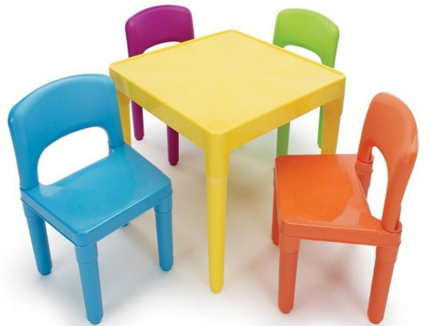
ملحق رقم (2) يوضح نموذج الكراسي و الطاولات