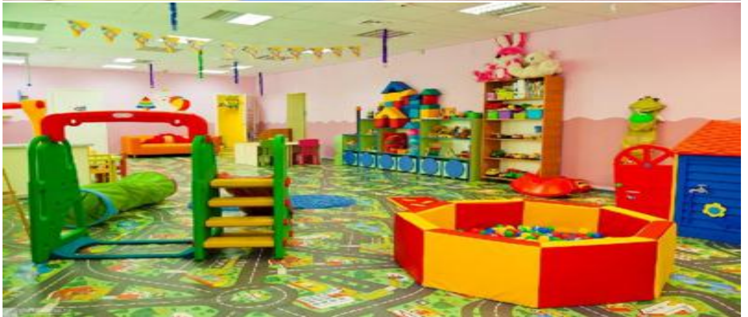
ملحق رقم (3) يوضح المحيط الداخلي للروضة النموذجية