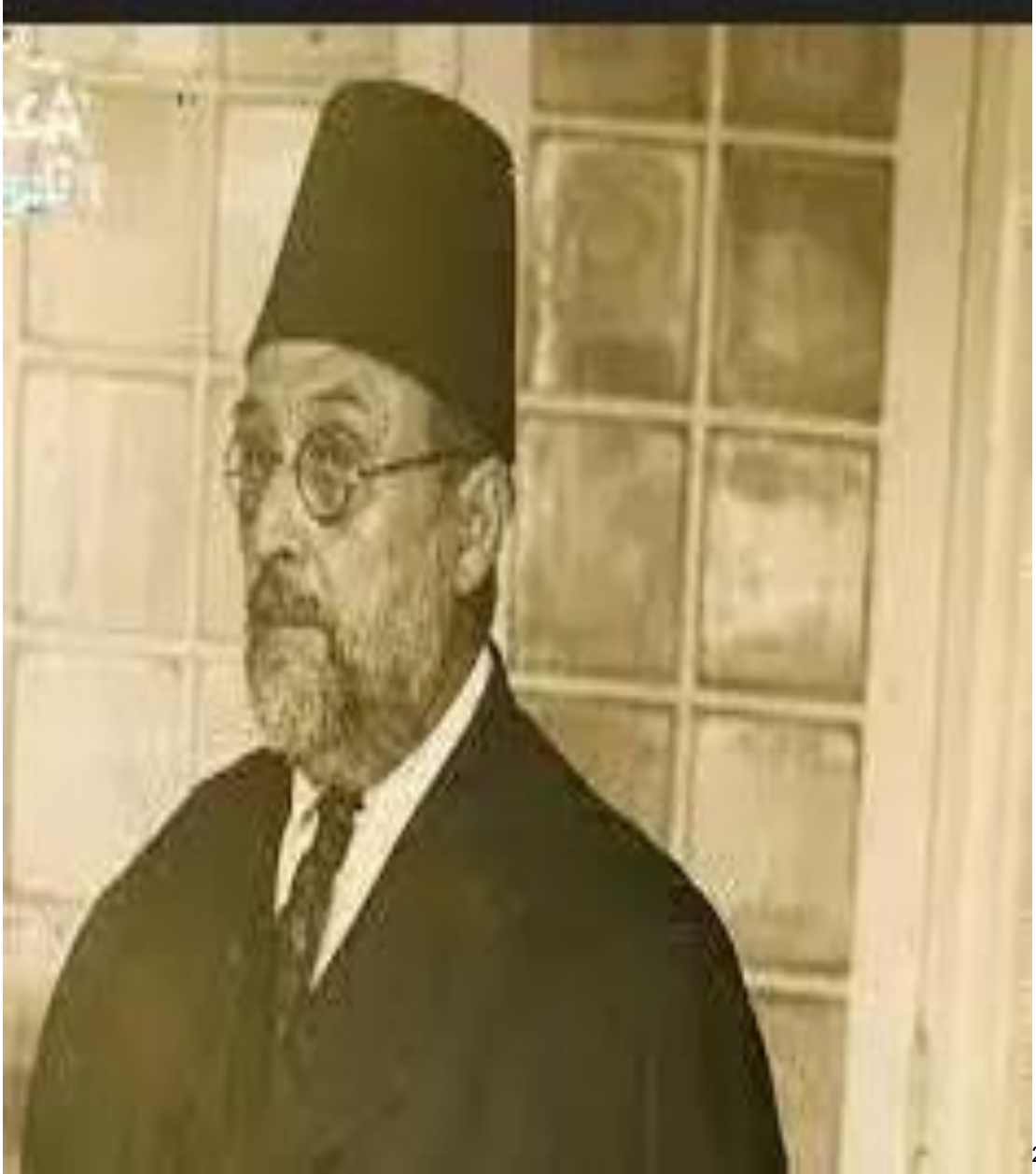
الملحق رقم 7: صورة عبد العزيز الثعالبي 1