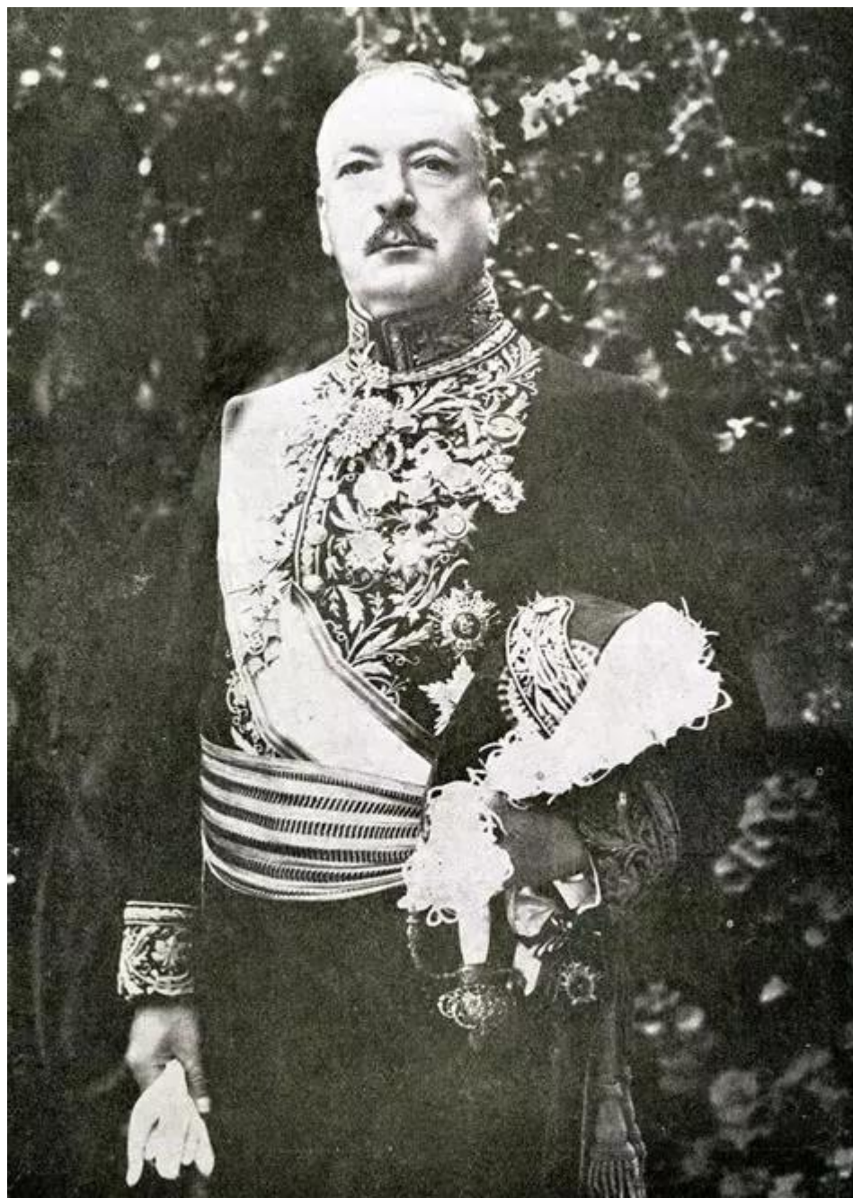
الملحق رقم 9: صورة سان لوسيان 1