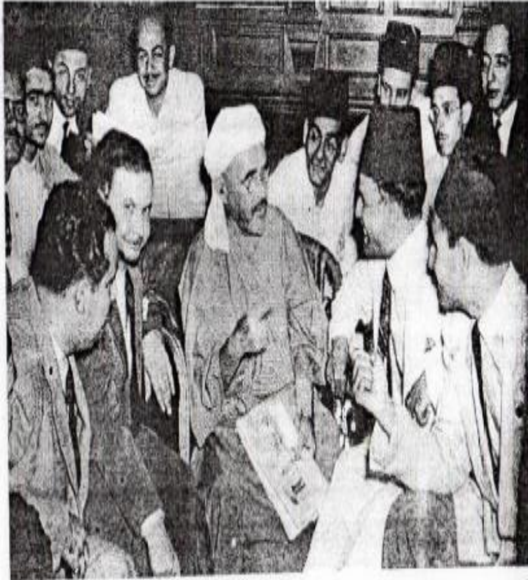
الأمير عبد الكريم الخطابي إثر وصوله إلى القاهرة مع زعماء المغرب العربي في مكتب المغرب العربي إلى يسار الأمير الرئيس الحبيب بوقبية ( تونس ) السيد الشاذلي المكي ( الجزائر ) والإمام علال الفاسي ( المغرب الأقصى ) والإستاذ عبد الحفيظ المريني ، ( المنغلة التشيلية بالمغرب الأقصى ) ( 1947 )

الملحق رقم 06: يوضح صورة عند وصول الأمير عبد الكريم الخطابي إلى مصر مع علال الفاسي