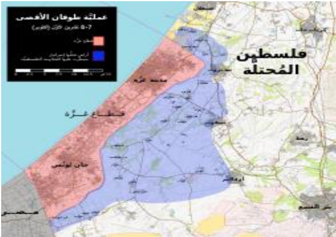
الشكل رقم 01 يمثل التوغّل الإسرائيلي في غزة

الوضع الميداني في منطقة غلاف غزة بين 7 و 8 أكتوبر، بعد اجتياح المقاومة الفلسطينية للحاجز وتوغّلها وسيطرتها على عدد من البلدات والمستوطنات. رغم مرور عدّة ساعات على