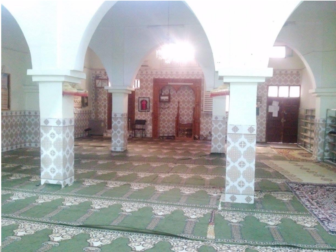
صور لمسجد الخليفة 1