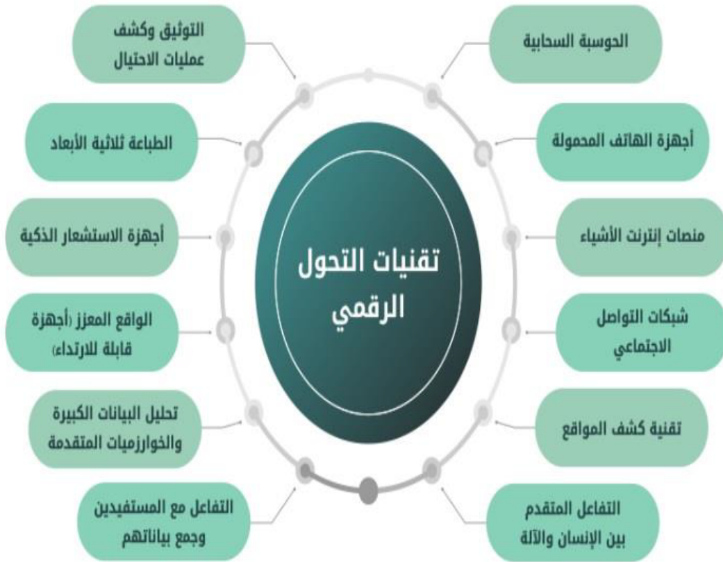
شكل (1): تقنيات التكنولوجيا الرقمية