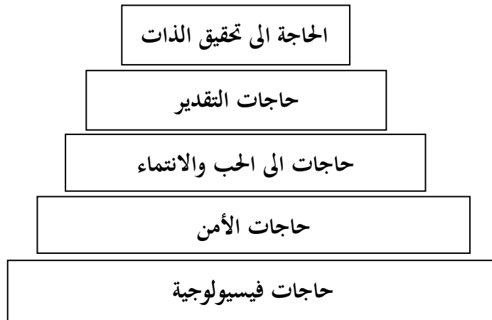
الشكل رقم 01 : هرم ماسلو للحاجات

وفضل ما هو اعداد نموذج هرمي للدوافع والحاجات الاساسية