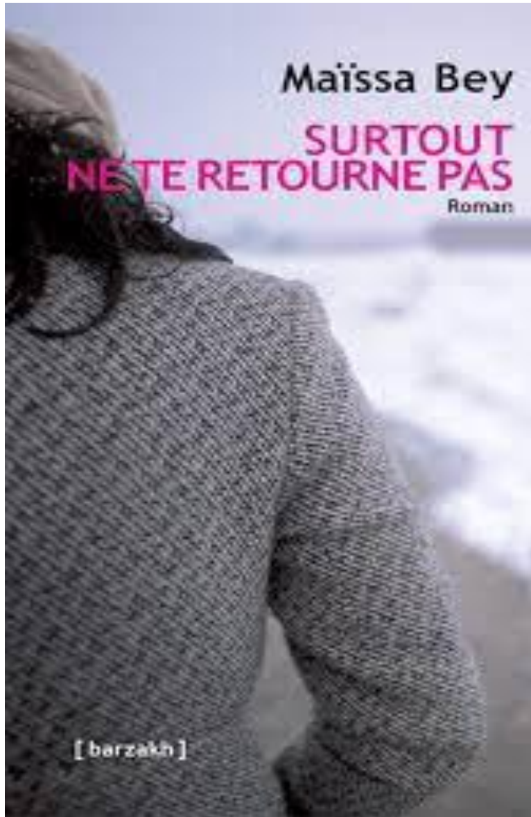
Première de couverture de « Surtout ne te retourne pas »