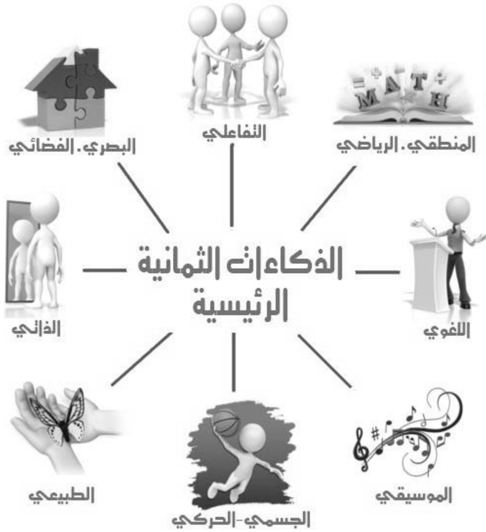
شكل رقم 01 يوضح أنواع الذكاءات المتعددة