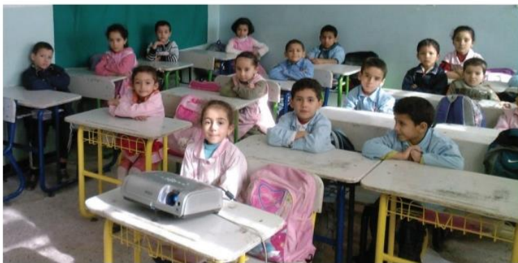
▲ أبناء المدارس

إنّك تمثّل أمل والديك وأساتذتك وبلدك، في أن تكون مواطننا صالحا في الغد. - استعن بقصيدة «إلى أبناء المدارس» لتعرف السبيل إلى تحقيق ذلك.