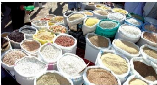
▲ حبوب وتوابل معروضة للبيع

- ذهبت لتشتري بعض الأغراض للبيت، فوجدت صاحب الدكان يتصرف مثل التاجر الذي عرفته في الخطاب المسموع، فكان لك منه موقف.